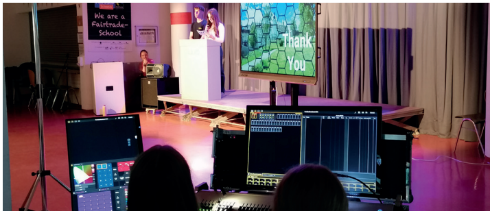
Die Ton-und-Licht AG unterstützt eine Präsentation der SMV.

Unser umfangreiches Sozialcurriculum , das auch zahlreiche Bausteine und zusätzliche Schulstunden zur Medienerziehung beinhaltet, zeigt Wege, wie wir als Schulgemeinschaft miteinander umgehen und gesund leben wollen. Mit zusätzlichen Klassenlehrerstunden und Maßnahmen wie dem Klassenrat , leisten wir wichtige Beiträge zur Demokratiebildung, Wertebildung und zum Zusammenhalt unserer Schülerinnen und Schüler. Das Beratungsangebot am HG wird durch unseren Schulsozialarbeiter ergänzt. Er ist die kompetente Anlaufstelle für die